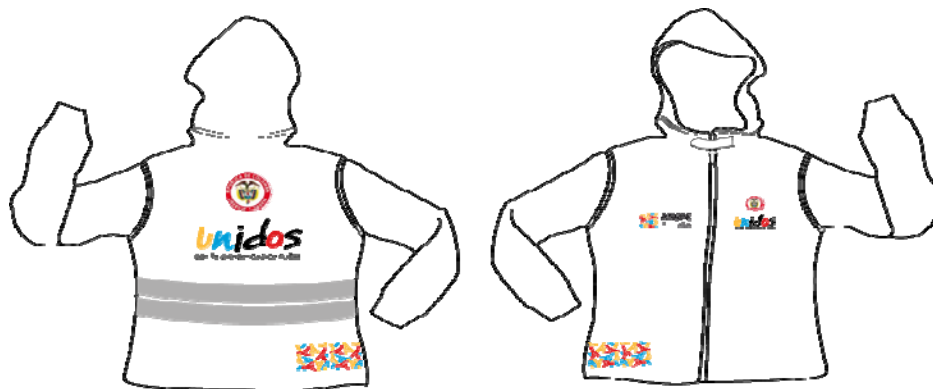
(Muestra chaleco – chaqueta con logos bordados)