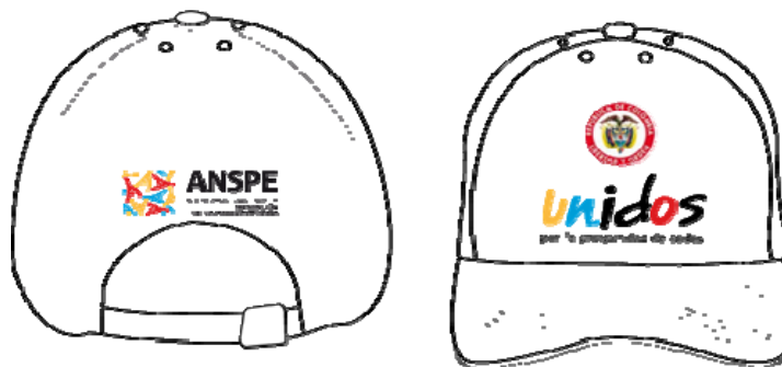
(Muestra cachucha con logos bordados)