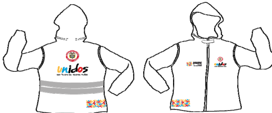
(Muestra chaleco – chaqueta con logos bordados)